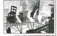
La collection de mobilier portugais d'habitat III.

Portugal 1993 "Le design portugais" est une exposition de mobilier portugais, organisée par l'Office Commercial du Portugal.