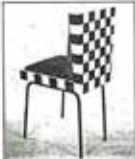
Alber Terzi, pour sa maison "Tapas", Barcelone (1987) de Manuel Delgado.